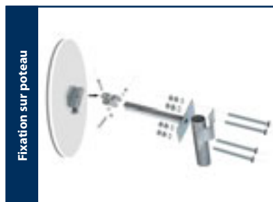
Fixation sur poteau